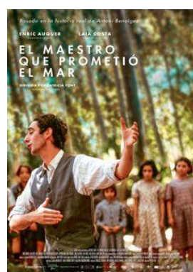
El maestro que prometió el mar V.O. en castellà i català

Més informació www.cinemaperaestudiants.cat