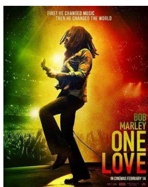
Bob Marley: One Love V.O. anglès subtutelada en castellà