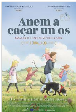
Anem a caçar un os Versió doblada al català

El dia de la sessió es realitza una introducció audiovisual abans de la projecció.