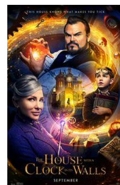
The House with a Clock in Its Walls V.O. anglès subtutelada en castellà