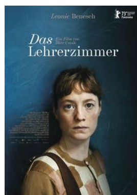
Das Lehrerzimmer V.O. alemany subtutelada en castellà