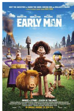
Early Man V.O. anglès subtutelada en català