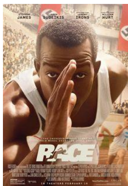
Race V.O. anglès subtutelada en castellà