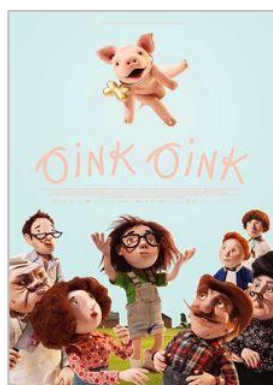
Oink Oink Versió doblada al català