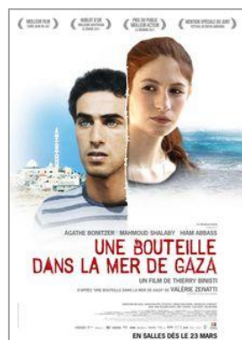
Une bouteille dans la mer de Gaza V.O. francès, àrab, anglès i hebreu subtutelada en català