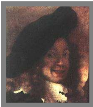
VERMEER VAN DELFT, Jan (b. 1632, Delft, d. 1675, Delft)

domestic final documents painters headman lenses sensitivity obscura rare divides inherited represent