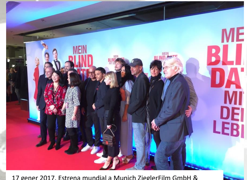
17 gener 2017. Estrena mundial a Munich ZieglerFilm GmbH & Co.KG @ZieglerFilm

Vorstellungsgespräch / Eine Filmkritik schreiben ..... 8